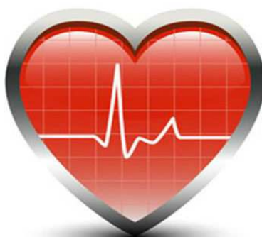
Régulateur fréquence cardiaque