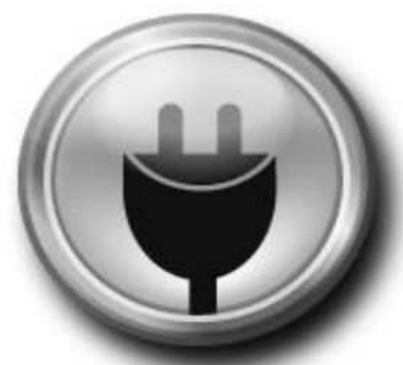
Montage 220 V (S1 S2 S3)